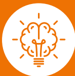
Kennis van zaken

Ongeacht de grootte of complexiteit van uw vraagstuk, wij organiseren altijd dé oplossing voor het gewenste en beste resultaat!